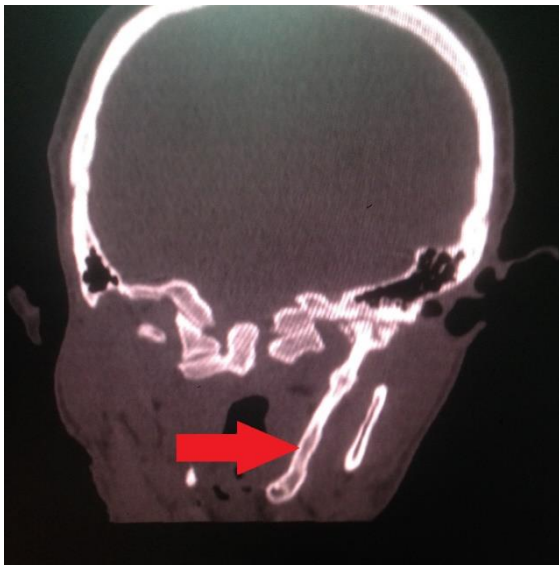
Figure 1 : Scanner cérébral, coupe coronale en fenêtre osseuse montrant une apophyse styloïde anormalement long avec calcification du ligament stylo-hyoïdien (flèche rouge)

Il s'agit d'un homme de 48 ans qui avait présenté une douleur latéro-cervicale gauche suite à un traumatisme crânien bénin. Il n'avait pas d'antécédent particulier avant le traumatisme. L'examen neurologique était normal. La palpation des régions latéro-cervicales provoquait la douleur. Vu le contexte traumatique, une radiographie du rachis cervical a été réalisée mais n'objectivait pas de lésion rachidienne évidente. Un scanner cérébral et du rachis cervical complémentaire a été demandé objectivant la présence d'un processus styloïde gauche anormalement long (Fig 1 et 2). Il n'avait pas de lésion cervicale ni cérébrale décelée. Le diagnostic de syndrome d'Eagle a été posé. Le patient a bénéficié d'un traitement médical à base d'anti-inflammatoire.